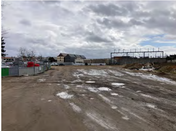
Des espaces publics à créer nés d'une friche industrielle