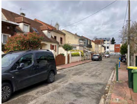
Des espaces à requalifier