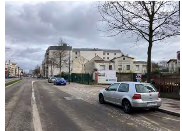
Un alignement sur l'avenue du Général de Gaulle à retrouver